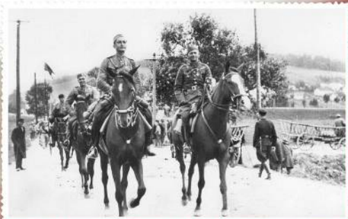
Ppłk August Emil Fieldorf na czele 51. Pułku Piechoty Strzelców Kresowych w Brzeżanach, 1939 rok.

W związku z narastającą w końcu 1943 roku liczbą egzekucji ulicznych dokonywanych przez okupanta niemieckiego na ludności cywilnej Warszawy, płk „Nil” wydał rozkaz przeprowadzenia zamachu na Franza Kutschere, odpowiedzialnego za serię egzekucji. Następnego dnia, po akcji polskich konspiratorów, Niemcy w odwecie rozstrzelali stu Polaków. Do czasu Powstania Warszawskiego była to ostatnia tak liczna egzekucja uliczna.