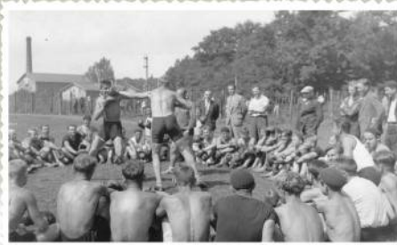
Grupa Polaków podczas ćwiczeń z przysposobienia wojskowego we Francji. Ppłk August Emil Fieldorf stoi szósty od prawej, 1931 rok.

W 1943 roku, w obliczu zagrożenia Polski okupacją sowiecką, płk „Nil” otrzymał niezwykle trudne i odpowiedzialne zadanie utworzenia i kierowania tajną organizacją „NIE” („Niepodległość”), która miała jej się przeciwstawić.