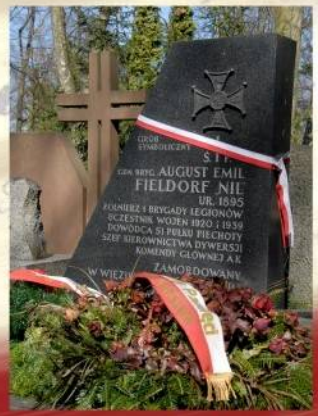
Symboliczny nagrobek gen. Augusta Emila Fieldorfa „Nila” na warszawskich Powązkach.