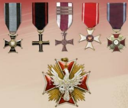
Gen. August Emil Fieldorf „Nil” za zasługi w czasie I i II wojny światowej oraz wojny polsko-bolszewickiej został dwukrotnie odznaczony Orderem Virtuti Militari, czterokrotnie Krzyżem Walecznych, Krzyżem Niepodległości, Krzyżem Kawalerskim Polonia Restituta oraz Złotym Krzyżem Zasługi. W 2006 roku pośmiertnie nadano mu Order Orła Białego.

7 marca 1989 roku prokurator generalny PRL wydał postanowienie, iż August Emil Fieldorf nie popełnił zarzucanego mu czynu. 29 lutego 2008 roku Sejm RP w 55. rocznicę śmierci gen. „Nila” podjął uchwałę, której jeden z zapisów brzmi: „August Emil Fieldorf jest przykładem człowieka, który całe życie poświęcił walce o niepodległość i suwerenny byt Rzeczypospolitej Polskiej”.