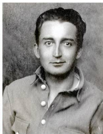
Por. August Emil Fieldorf, 1920 rok.