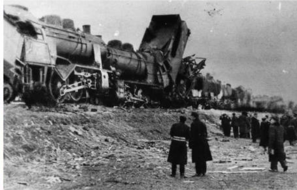
Żołnierze Kedywu przeprowadzali akcje polegające m.in. na wykołajaniu pociągów i torów kolejowych, powodowaniu szkód w zakładach przemysłowych wykorzystywanych dla potrzeb wojska okupanta oraz dokonywaniu zamachów na funkcjonariuszy policji i administracji niemieckiej.